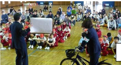
5月13日(土) 3年自転車教室

神町小は、始業式から 事故0 を 継続中 です。昨年度は 山形県の交通安全優良校 として表彰も受けています。事故ゼロをこれからも継続していくために、3年生においては、PTA自転車教室を実施しました。「ヘルメット着用」、「左側通行」、「正しい横断」といった基本的なことを大切にしていくことを学びました。歩行においては、「右側一列歩行」、「左右確認」を徹底していきます。