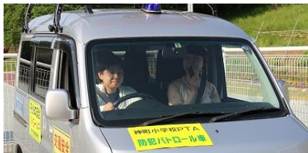
PTA不審者対応 パトロール

また、今年度も、PTA活動として、「朝の立哨指導」(1・2年保護者)と「不審者対応パトロール」(5・6年保護者)が、5月から始まりました。ご協力よろしくお願ひします。