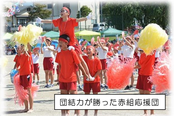
団結力が勝った赤組応援団