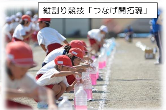
縦割り競技「つなげ開拓魂」