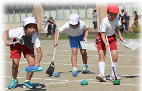
3・4年遊競技 「エコは地球を救う」