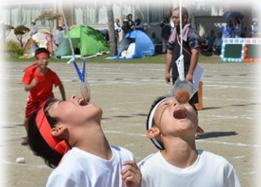
5・6年遊競技 「わたし、神ってます」