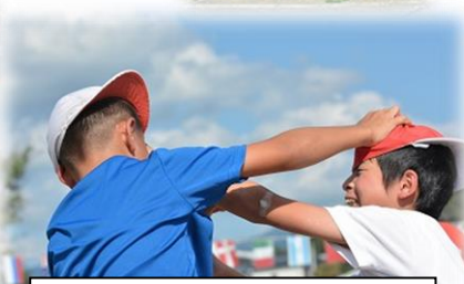
高学年団体競技 「騎馬っていきましょう」