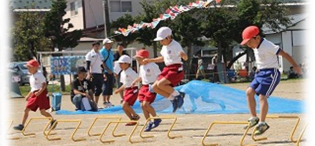
1・2年生遊競技 「くぐって とんで まわして ゴー」

★今年度も、場所取りのルールをしっかり守っていただいたこと、感謝申し上げます。ありがとうございました。