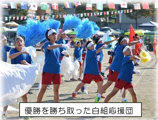
優勝を勝ち取った白組応援団